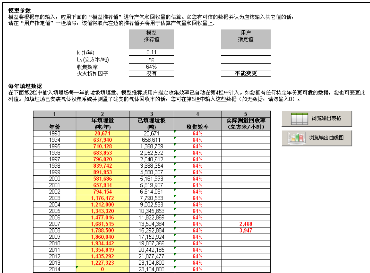
图 3 - 模型输入截图(续)