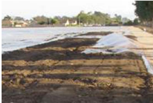
Las lonas rotas pueden causar que los gases de fumigantes se liberen al aire.