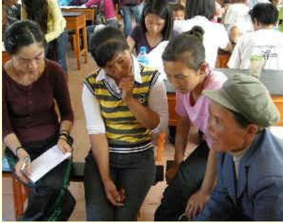
中国一些学生在考虑有关环境议题的输入资料

公民参与不单单是一件好事或该做的事；事实上它会形成更好的结果与治理。当以一种有意义的方式完成时，公民参与会造成两项重大效益：