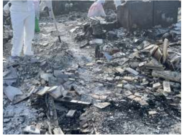
Ata o se auvaa i luga o se fanua mu ina ua uma ona fa'aogaina le soiltac; ua le toe iloa atu le pefu opeopea.