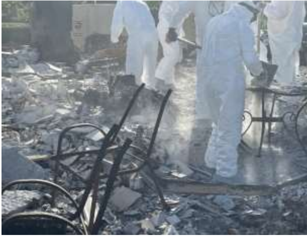
Ata o le auvaa i luga o se fanua mu ma le lefulefu o lo'o alu a'e i luga o latou; na pu'eina ata a'o le'i fa'aogaina le soiltac.