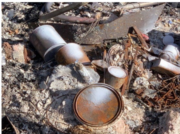
将被清除的危险材料示例：