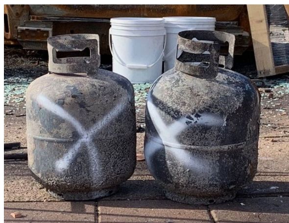
EPA 检查的空容器将标记白色 X，进行安全处理，并留待在第二阶段（废弃物清除）时移除。